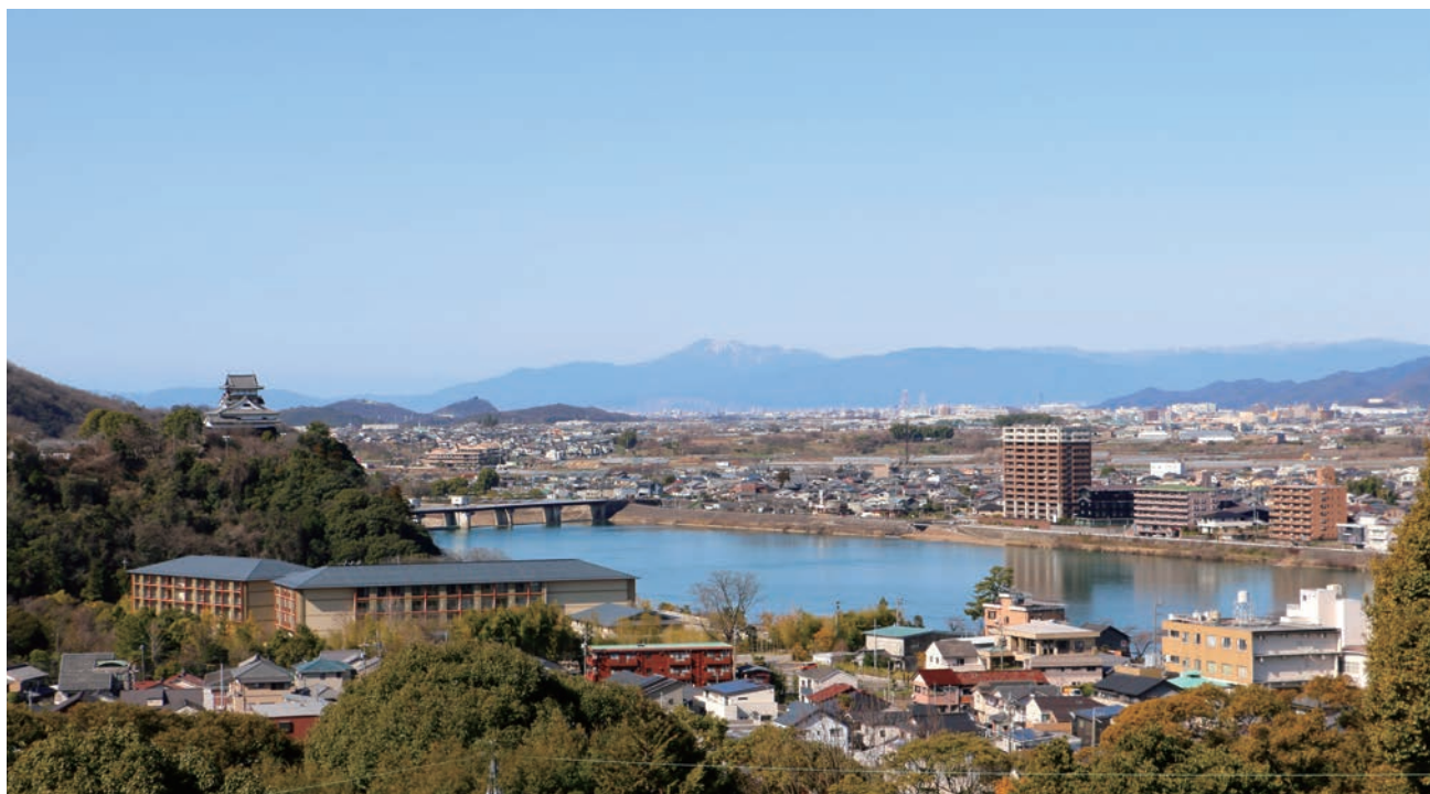
本堂前舞台より望む春の風景。正面に伊吹山、木曾川、左に犬山城が見える。||二月二十八日撮影