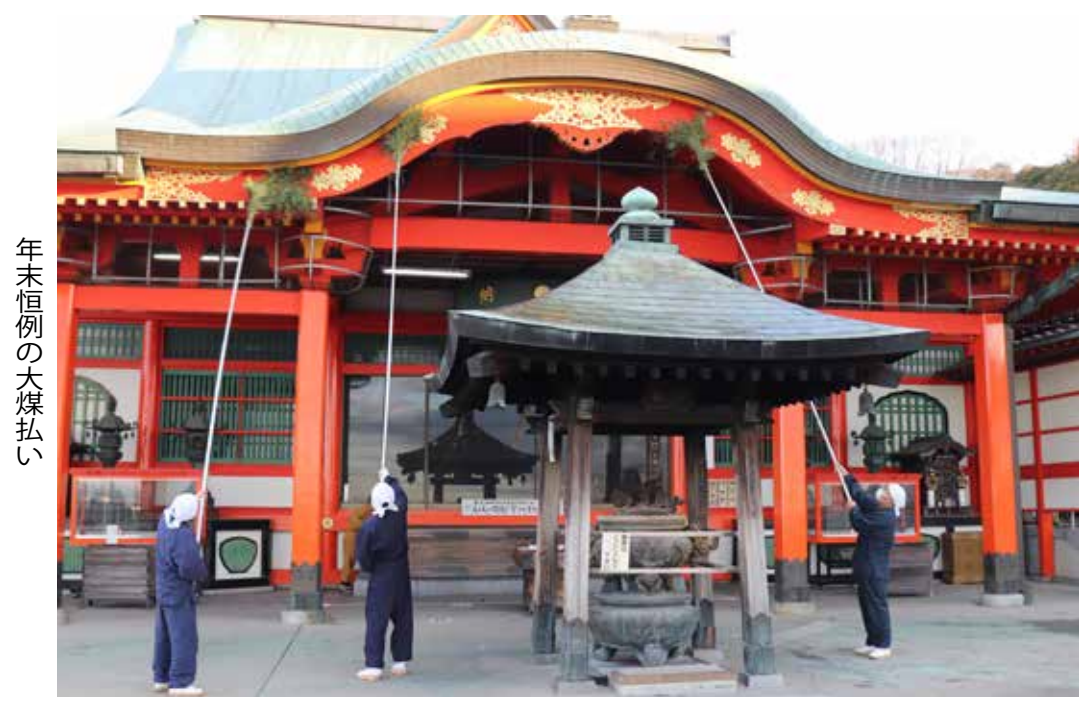
年末恒例の大煤払い

日本ホッケー界の現状を変えるため、世界の舞台で結果を出すことを目標に努力を重ねてきました。しかし、私が参加した3大会のオリンピックで1勝という結果に終わりました。思い返せば楽しいはずのホッケーが、背負うものが大きくなるほど厳しく辛い事ばかりの連続に変わっていききました。しかし諦め