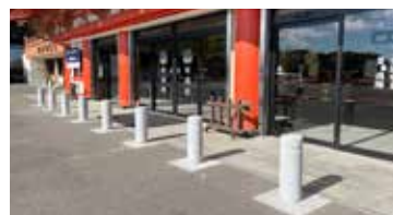
自動車祈禱殿前バリケード一式 ミロク工業株式会社様 (半田市)