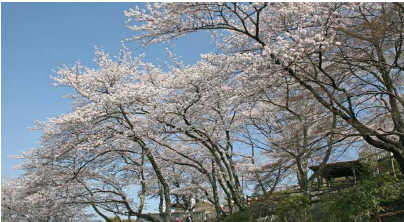
春爛漫の「憩いの場」