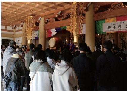
交通安全自動車御祈禱