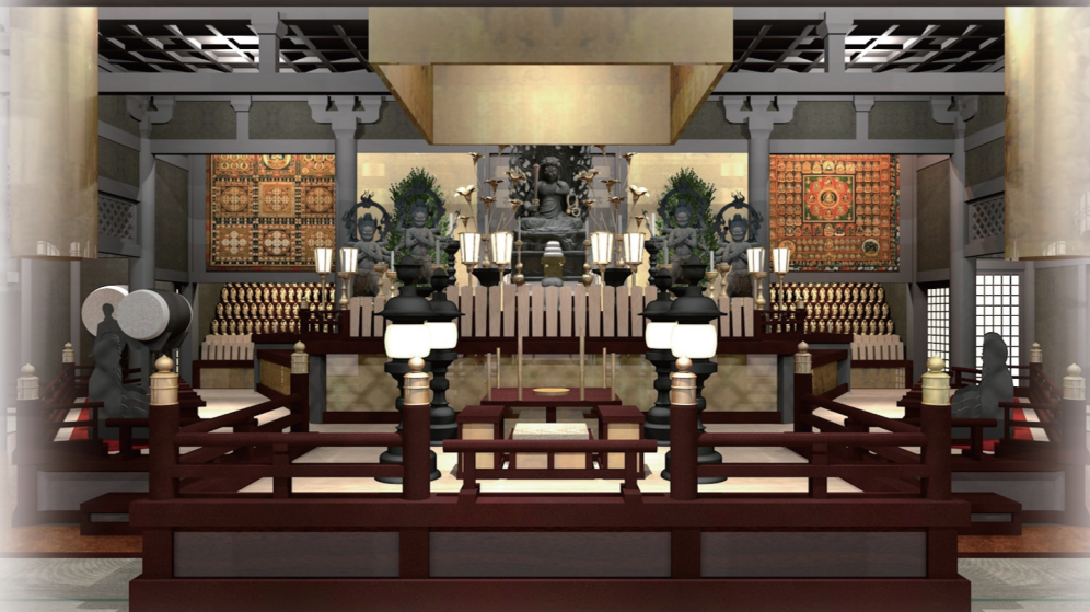
本堂内イメージ図