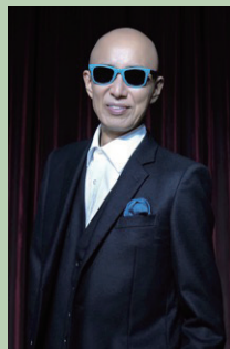
サンプラザ中野くん

■歌手 1984年に爆風スラン プのヴォーカルとしてデ ビュー。パワフルで奥深いサウ ンド、ユニークかつ斬新なパ フォーマンスで人気を博す。